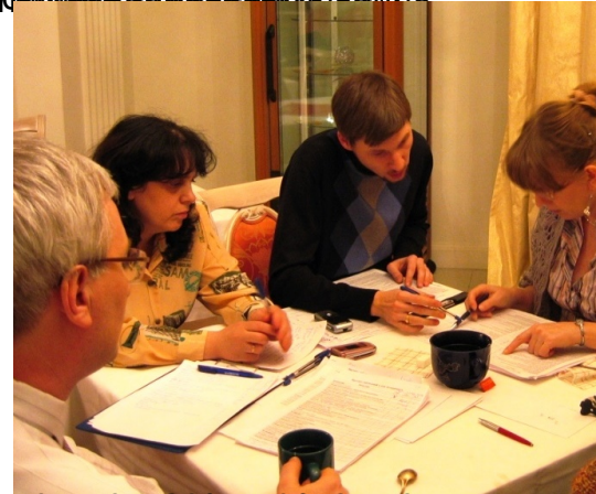
Санкт-Петербургский государственный университет, профессор