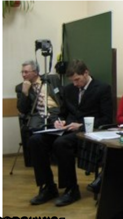
Санкт-Петербургский государственный университет, профессор