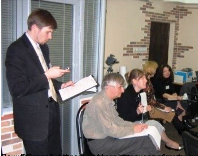
Санкт-Петербургский государственный университет, профессор