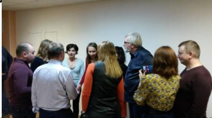
Психологический тренинг "Инструмент"