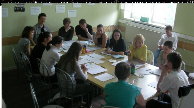
Экспертный семинар в рамках реализации проекта в Московской области