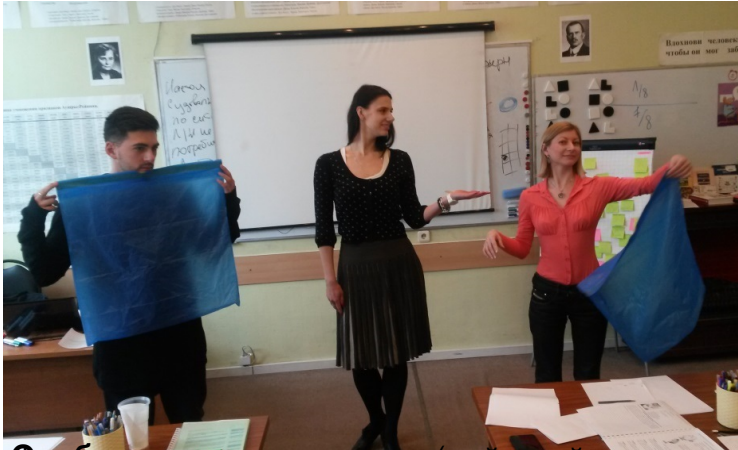
Вводная часть занятия