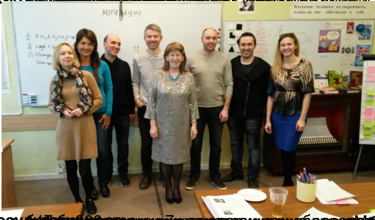
Воспитательная работа с родителями обучающихся в рамках реализации проекта в Московской области