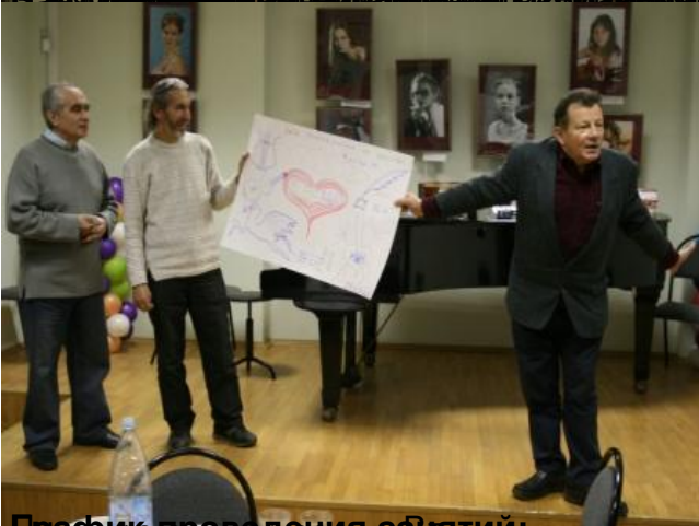
График проведения занятий: 20.00 - 21.00 - в СР, 10.00 - 12.00 - в ЧТ, 18.00 - 20.00 - в ПТ. адрес: afanasyev@psypho.ru телефон: +7 (916) 362-81-72