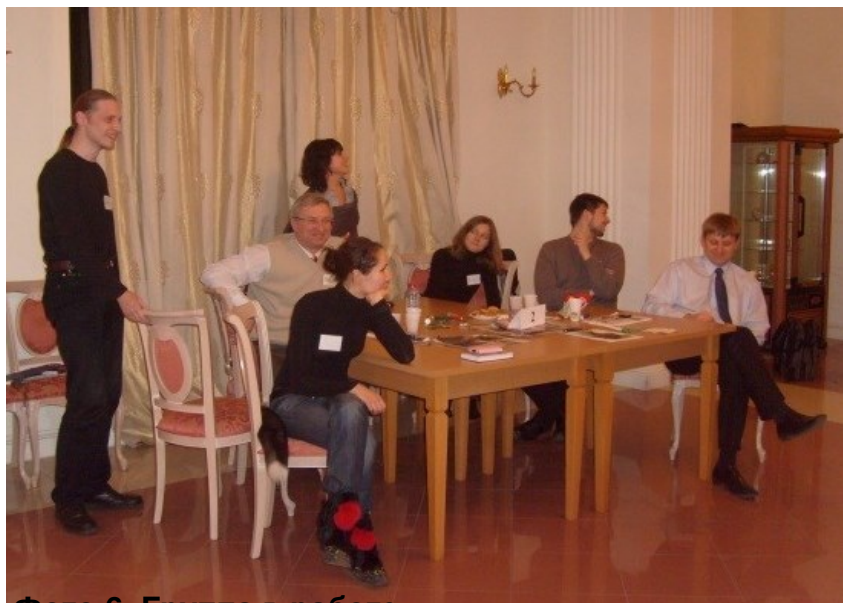
Фото 6. Группа в работе