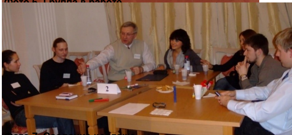
Фото 7. Совещание коллег