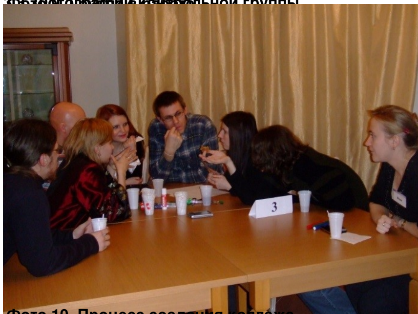
Фото 10. Процесс создания коллажа