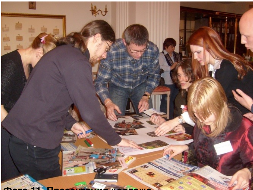
Фото 11. Презентация колледжа