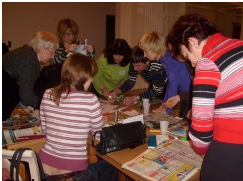
Фото 4. Презентация коллажа