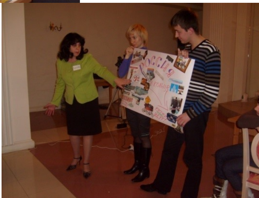
Фото 5. Презентация группы демократов