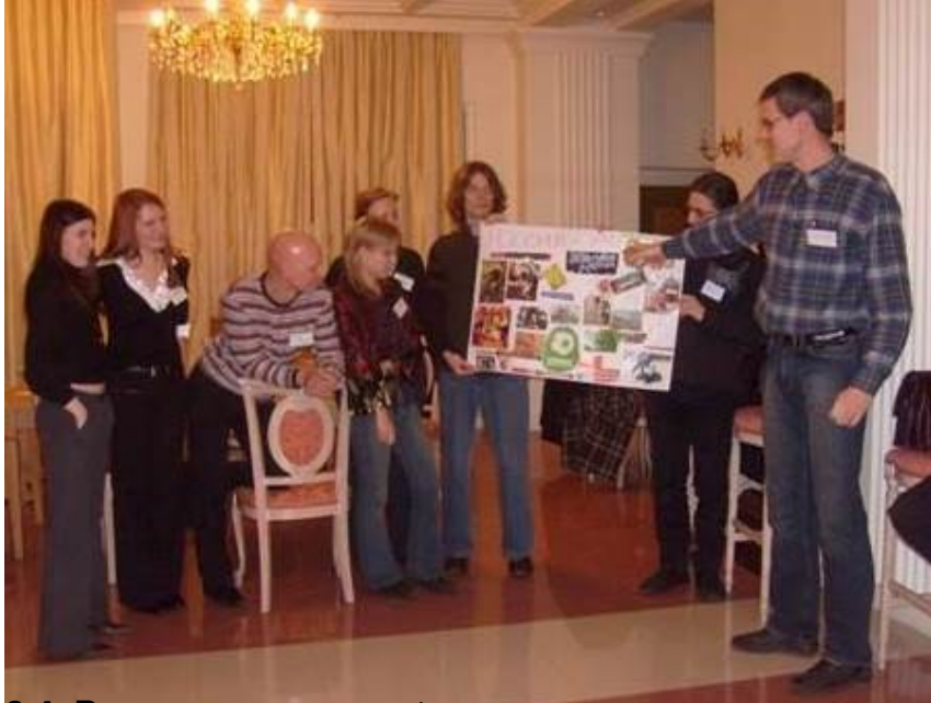
3.4. Выделение проблемных экспериментальных исследований, разработанных для плана. Видеоматериалы описания процесса групповой работы и презентации.