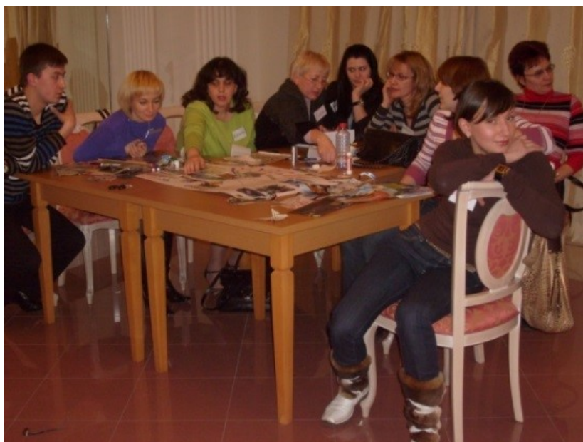
Фото 3. Создание коллажа