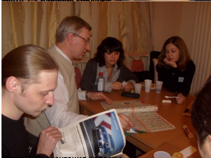
Фото 8. Презентация коллажа