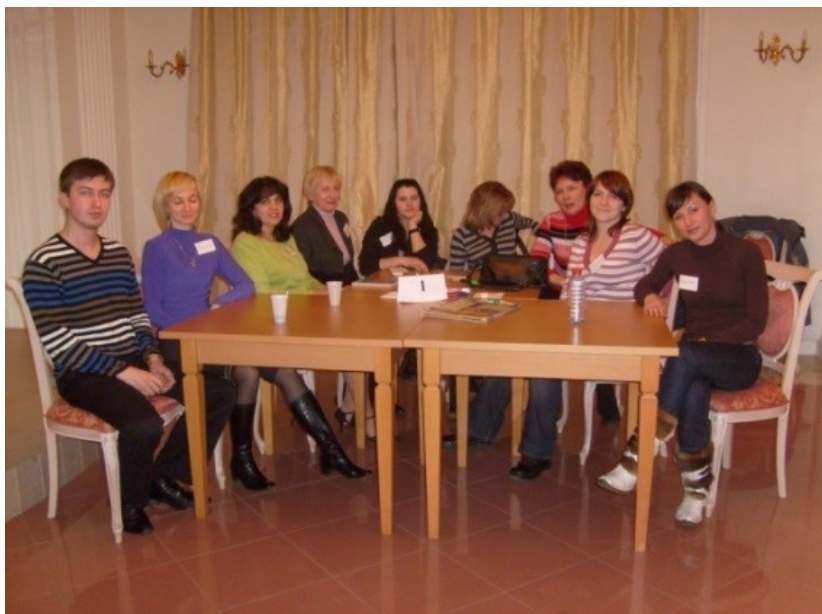
Фото 2. Группа в работе